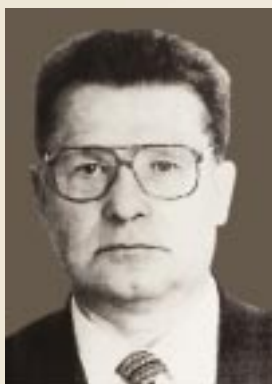
В.И. Игревский выпускник МНИ им. И.М. Губкина 1949 г., зам. министра геологии СССР (1964–1980 гг.), первый зам. министра нефтяной промышленности СССР (1980–1988 гг.)